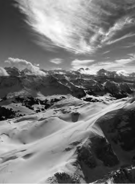
Berner Oberland von der Schrattenflue

wir die Felle aufziehen und Richtung Hengst losmarschieren. Zuerst einen steilen Hang hoch und anschliessend über ein langes, flaches Stück – so präsentierete sich das erste Drittel des ca. 3,5-stündigen Aufstiegs. Der zweite Teil, welcher