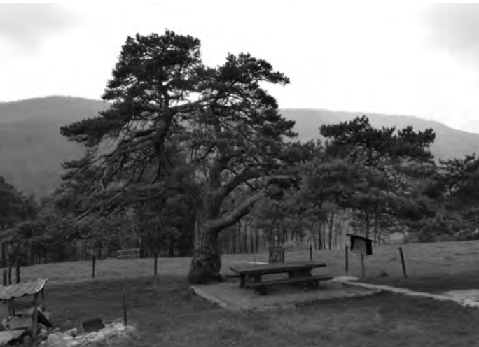
Uralter Baumbestand bei der Cabane

Grillstellen, die Stimmung ist gut. Im Angebot hat es Wein, Kaffee und Chrömli, alles ist da. Die Bise bläst immer noch und so sind wir froh, wieder aufbrechen zu können und wandern gemeinsam die letzte und auch schöne Etappe nach Mervelier hinunter zum