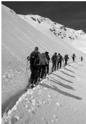
Freitag: Vom Lai da Tuma zum Fil Tuma