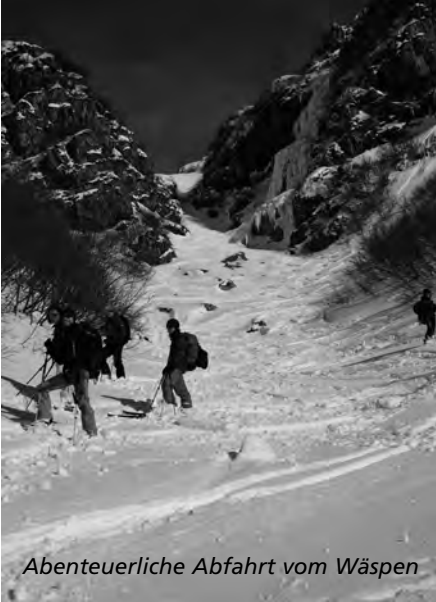
Abenteuerliche Abfahrt vom Wäspen

und sternenklarer Nacht eine Wassertemperatur von 40°C. Einfach herrlich!