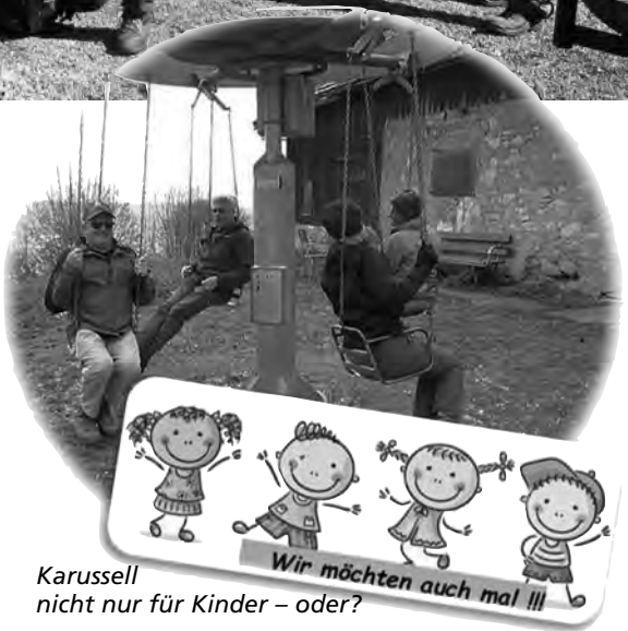
Karussell nicht nur für Kinder – oder?

Text Sofia Bütler