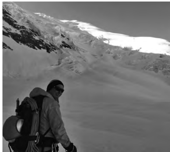
Tag 3: Ein perfekter Beginn Richtung Weissmies

«Hillary step»: Zahlreiche Spitzkehren im steilen, harten Firn, zunehmender Wind und deutlich tiefere Temperaturen gingen an die Substanz, weckten aber erst richtig den Drang nach dem Gipfel. Die letzten