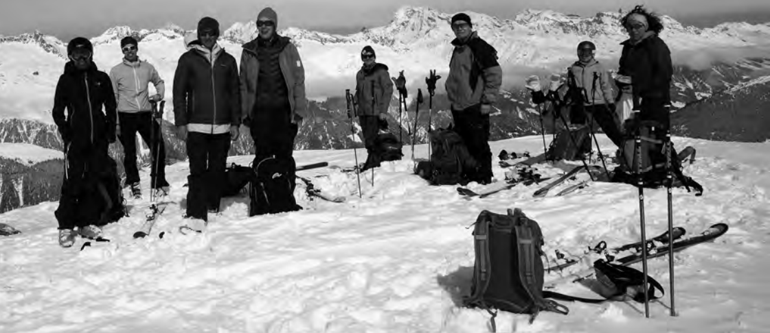
Sonntag: Noch gutes Wetter am Pazola

Mo, 06. März: Unser heutiges Tourenziel ist der Vanatsch, 2464m, südlich von Sedrun gelegen. Von Cavorgia aus steigen wir durch den schön verschneiten Wald. Auf ca. 1900m erreichen wir die sanften Hänge der Cuolm Cavorgia. Leichter Schneefall wechselt sich ab mit milchigem Sonnenschein. Kurz vor dem Gipfelaufbau auf ca. 2300m werden die Triebsschneeansammlungen zu mächtig für ein sicheres Weitergehen. Im tiefen schweren Pulverschnee fahren wir ab, eine Aufgabe, die wir mit Spass und Humor angehen.