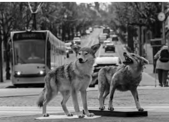
Böser und guter Wolf.

Menschen mit dem Familiennamen Wolf, Loup, Lupo o. ä. besuchen das Biwak «Der Wolf ist da» gegen Vorzeigen ihres Ausweises gratis und die Hauptausstellung im Alpinen Museum der Schweiz zu vergünstigtem Preis.