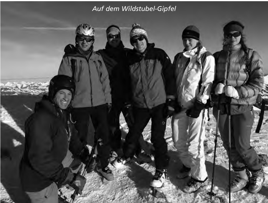
Auf dem Wildstubel-Gipfel

Nach einer sternenklaren und erholsamen Nacht ging es an der Vormittagstour für die männlichen Teilnehmer schlussendlich auf den Mittelgipfel des Wildstrubels (3243 müM). Nach einem sportlichen Aufstieg hiess uns der Wildstrubel mit Wolken und sehr starkem Wind willkommen. Umso schneller nahmen wir die Abfahrt unter die