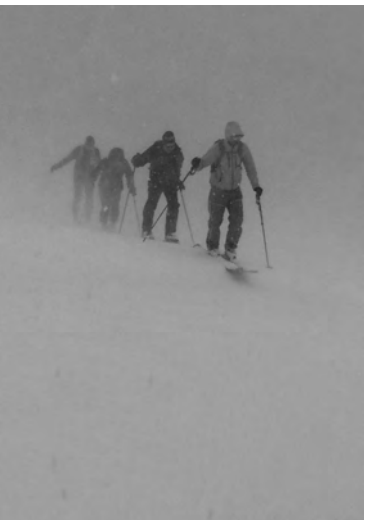
Dienstag: Begegnung bei der Alp Sisum