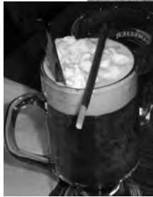
Man gönnt sich ja sonst nix!

Restaurant «Blume» ist für uns das Stübli reserviert, wo wir uns mit Kaffee und gut getränkter «Original Zuger Kirschtorte», oder sonst etwas Süßem, für unserer Leistung belohnen. Da jetzt sogar die Sonne lacht, entscheiden sich 6 nimmermüde Clubkameradinnen auf der Buuseregg das Postauto zu verlassen und nach