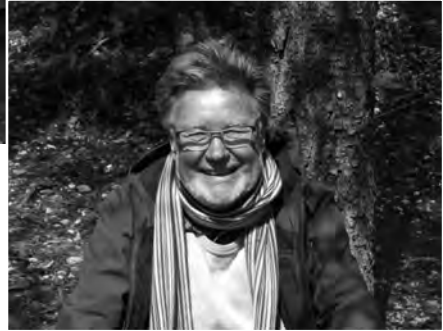
So sieht Zutriedenheit aus!

Grillstellen, die Stimmung ist gut. Im Angebot hat es Wein, Kaffee und Chrömli, alles ist da. Die Bise bläst immer noch und so sind wir froh, wieder aufbrechen zu können und wandern gemeinsam die letzte und auch schöne Etappe nach Mervelier hinunter zum