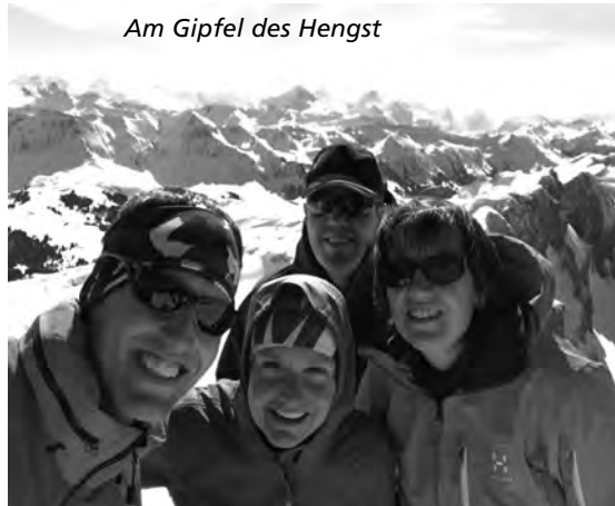
Am Gipfel des Hengst