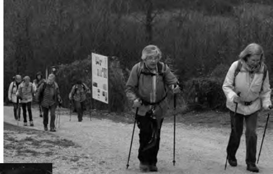
Aufstieg zum Sunneberg

Unterwegs treffen wir auf zartviolett blühenden Seidelbast, die ersten Schlüsselblumen, sowie auf frischgrünen Nieswurz. Trotz bewölktem Himmel haben wir immer wieder Ausblicke ins Baselbiet, erkennen den Sendeturm auf der Chrischona und sogar das höchste Bürogebäude der Schweiz, den Roche-Turm Nr. 1. Schon bald sehen wir den Turm auf dem Sunneberg, wo wir uns später im gemütlichen Turmstübli für die 2. Etappe der kurzweiligen Wanderung stärken. Nach einer ausgiebigen Rast marschieren wir mit neuem Elan unserem Ziel Magden entgegen. Zu unserer Freude lockert sich die Bewölkung immer mehr auf und die Sonne sucht sich ihren Platz. Im