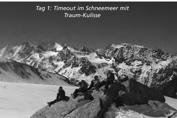
Tag 1: Timeout im Schneemeer mit Traum-Kulisse

Schlafen auf 3100m – naja! Die Technik, gegen Kopfschmerzen in der Höhe viel zu trinken, mag ja hilfreich sein, führt aber auch dazu, dass man die ganze Nacht aufs WC rennt und dadurch wieder hellwach