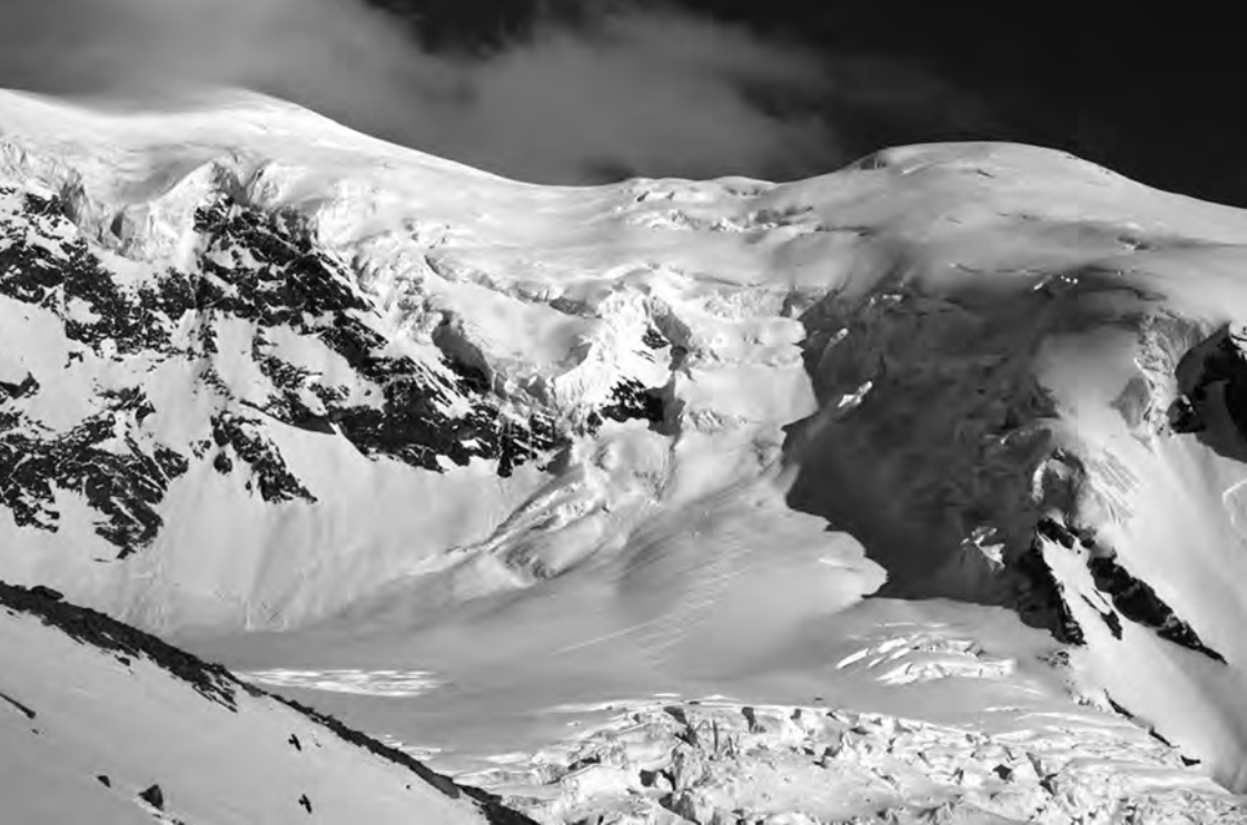
Weissmies, imposanter Klotz, Aufstieg in Bildmitte, rechts haltend, durch die Seracs hoch

100m Schlussgrat waren dann wirklich garstig und bei gefühlten minus 20 Grad und einem 50er Wind hatte man spätestens auf dem Gipfel wirklich alles an, was zur Verfügung stand. Zudem wünschte man sich die dicksten Fäustlinge und Daunenjacken, kratzte die Kälte doch schon spürbar an Händen und im Gesicht. Den Gipfel nahmen wir im zunehmenden Whiteout irgendwie gar nicht mehr wahr und nach kurzer Gratulation gings auch gleich wieder runter.