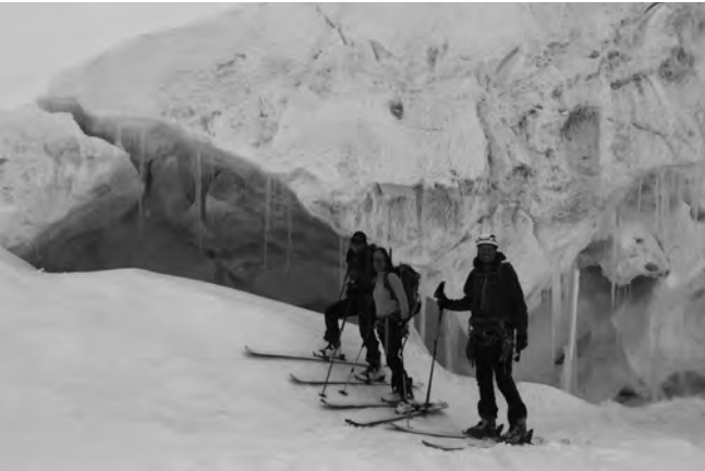
Tag 2: Seracs und Spalte am Fletschhorn

wird. Zudem waren die Schlafkojen unnötig eng, so dass grosse Personen kaum schlau liegen konnten. Nach entsprechender Nacht auf 3100m half nur eine Unmenge an Kaffee und ein ausgiebiges Frühstück am reichhaltigen Buffet des komfortablen Bergrestaurats.