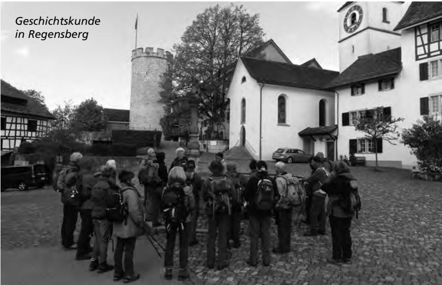
Geschichtskunde in Regensberg