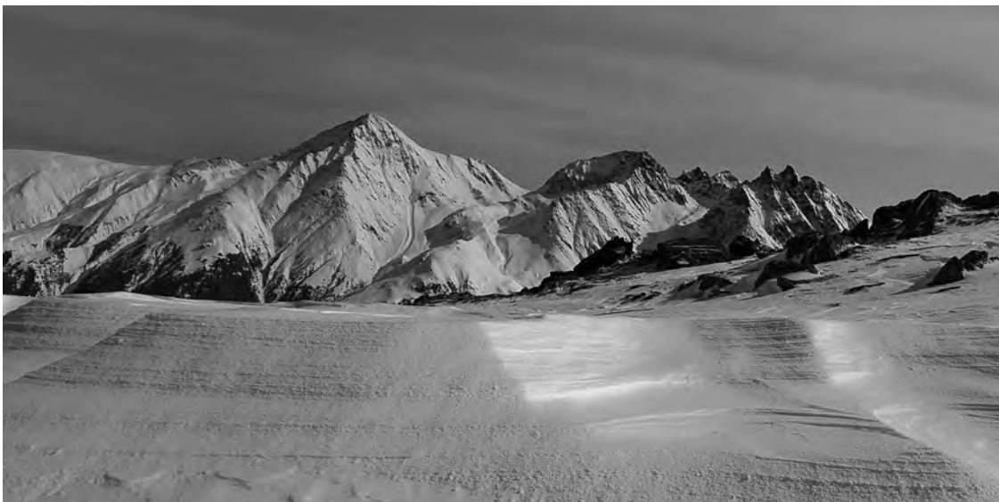
Sonntag: Wie in Blei gegossen: die Aussicht vom Piz Pazola

Di, 07. März: Garvers dil Tgom. Nach dem leckeren Frühstück machten wir uns auf den Weg, zuerst leicht abfahrend nach Surrein auf die andere Talseite. Mit den Fellen stiegen wir erst über Wiesen, anschliessen durch immer dicht-