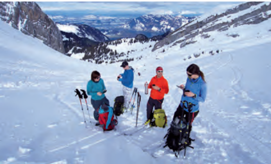
Ein Klassiker, die Aussicht auf 4-Waldstättersee und Rigi

Die erhebliche Lawinengefahr verunmöglichte unseren Plan A, die Skitour im Urnerland aufs Eggenmandli. Als Plan B ging es ebenfalls in die Innerschweiz, aber nach Niederrickenbach. Das Wetter meinte es gut mit uns und es wurde immer schöner. Wir genossen die wunderbare Aussicht hinunter zum See.