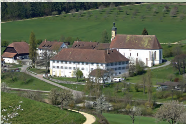
Das Kloster Olsberg