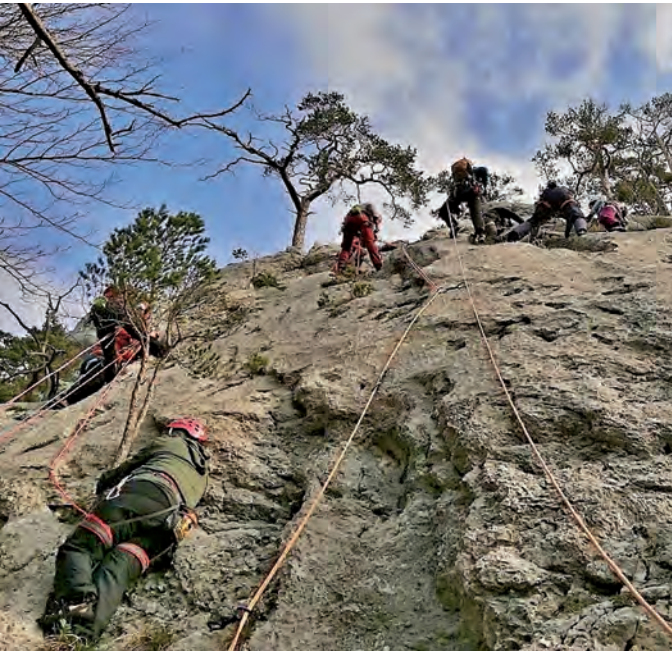
Viele begeisterte Kletterer

Wer jetzt aber denkt, alles sei super locker gewesen, der irrt! So liess Urs die Schreibende an einer unmöglichen Stelle einen Stand einrichten – im Seil hängend und ohne eine Ahnung, wo denn bitte die beiden Nachsteiger noch Platz haben sollten. Dabei wäre 2 Meter weiter oben ein «Pensionistenstand» in Form eines kräftigen,