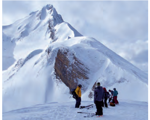
vom Glattigrat bewundern wir den Brisen