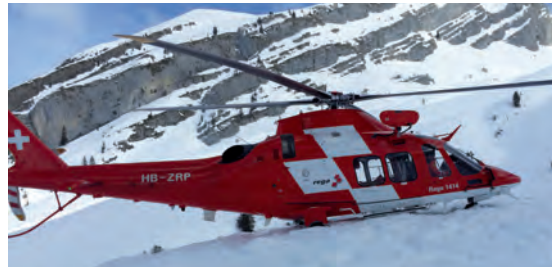
Der Heli, willkommen bei Rettungssätzen

Text: Muriel Jeisy-Strub