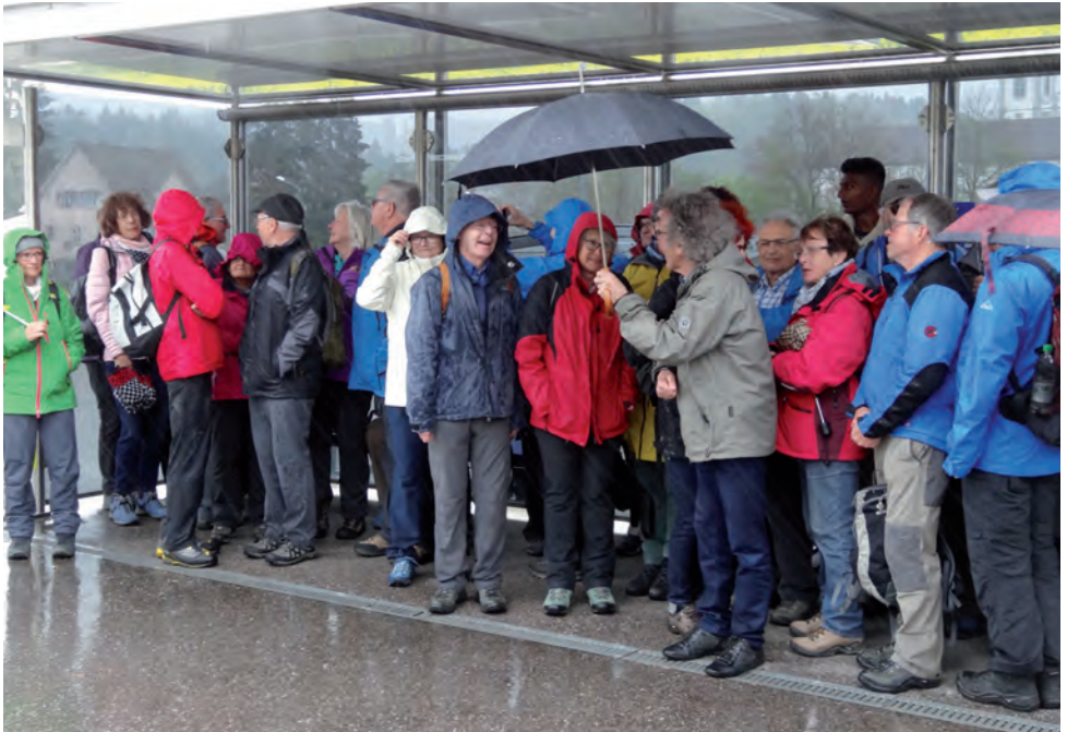
Auf dem Weg zum Bahnhof beginnt es zu regnen