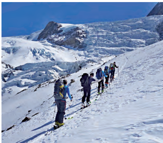
Endlich auf den «Latten». Aufstieg zur Bordierhütte