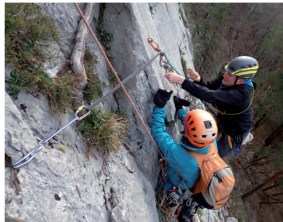
Standinstruktion mitten in der Wand