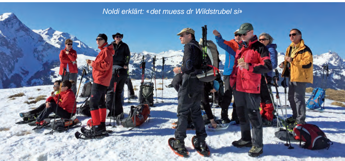
Noldi erklärt: «det muess dr Wildstrubel si»

Text: Leonie Imhof