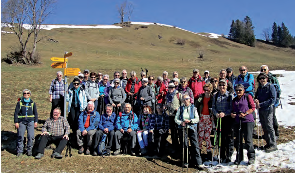
am Oberegg – nicht mehr viel Schnee am Hasliberg