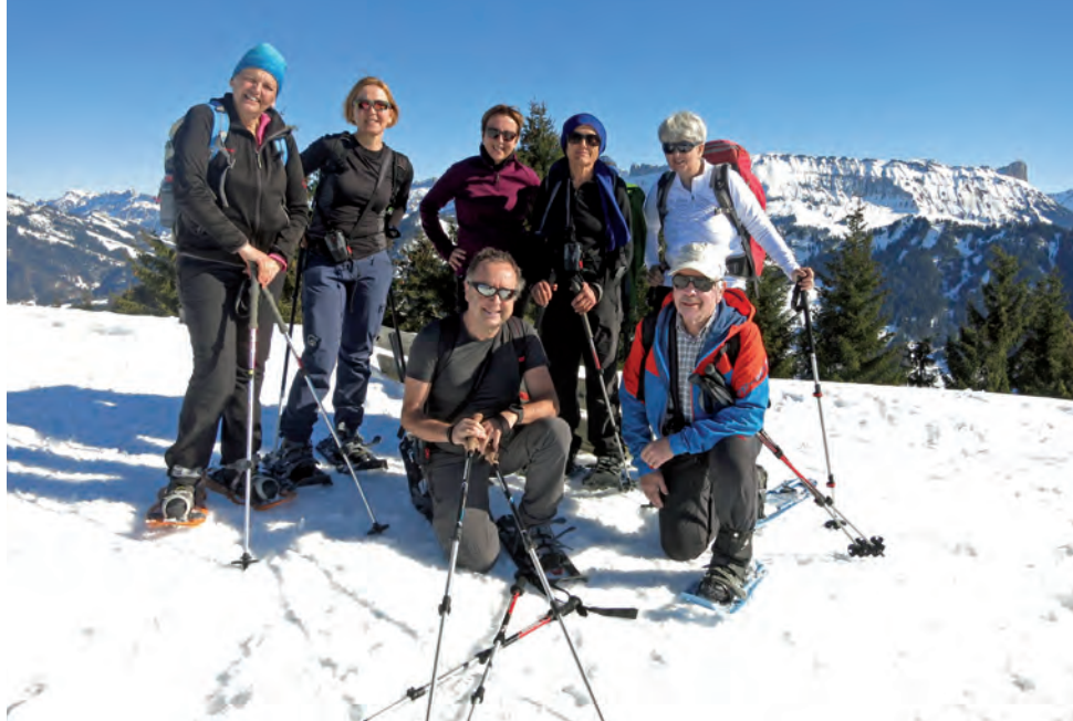
Gentlemen auf den Knien vor den Frauen (hinten Schratzenfluh mit Schibegütsch)