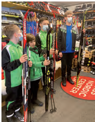
Wir sind nun perfekt ausgerüstet. Jetzt kann's losgehen!