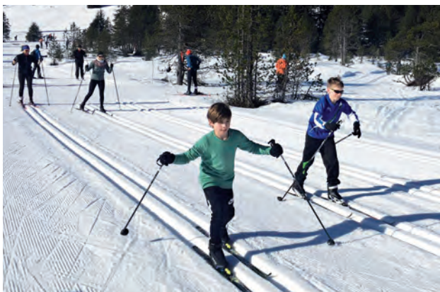
Langlauf klassisch, diagonal – geht ja schon ganz gut!

Einige sind vielleicht die Nachfolger von Dario Colonia: