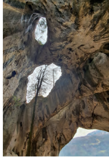
Durchs Bärenloch Sicht auf Welschenrohr ... Im Kreis: Wanderin ca.170cm