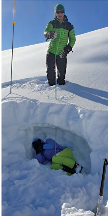
Mission erfüllt! So einfach!

Wie steil ist dieser Hang, welchen wir gleich hochsteigen werden? Gehen wir eher links in die Mulde oder rechts über den Geländerrücken? Wo könnte eine Lawine entstehen? Genau solche Fragen sind es, weshalb man sich an einem solchen Kurs anmeldet. Fragen, welche man sich bei organisier-