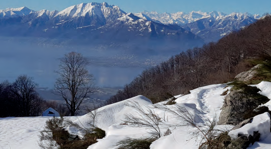
Monti – Monti – Monti....