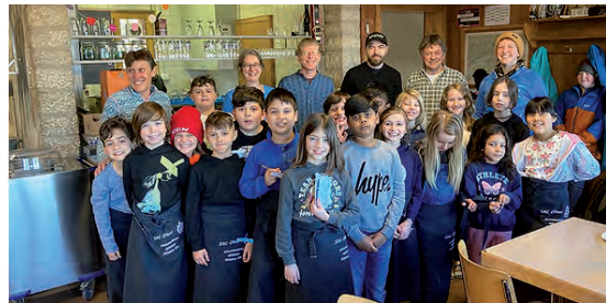
Die Einsatzgruppe am Samstag!

Wie in einem Bienenhaus ging es am Samstag 27.2.22 im General-Wille-Haus zu und her. Eine ganze Schulklasse servierte Suppe und Wienerli, Getränke, diverse selbstgebackene Kuchen und Köstlichkeiten. Für einmal das Schulzimmer für 4 Tage mit einer SAC-Hütte (und zwar der Weissmieshütte!) tauschen, in die Welt des Bergsports eintauchen, lernen wie der Alpenraum genutzt und gleichzeitig geschützt werden kann und muss, zusammen mit einem Bergführer die Region Saas-Grund und das Gebiet um die Weissmieshütte entdecken. Einen Gletscher aus der Nähe zu sehen, das ist das grosse Ziel, das die Schulklasse bis zum Septem-