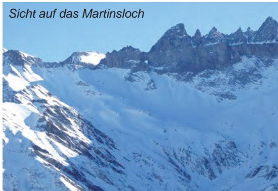
Sicht auf das Martinsloch