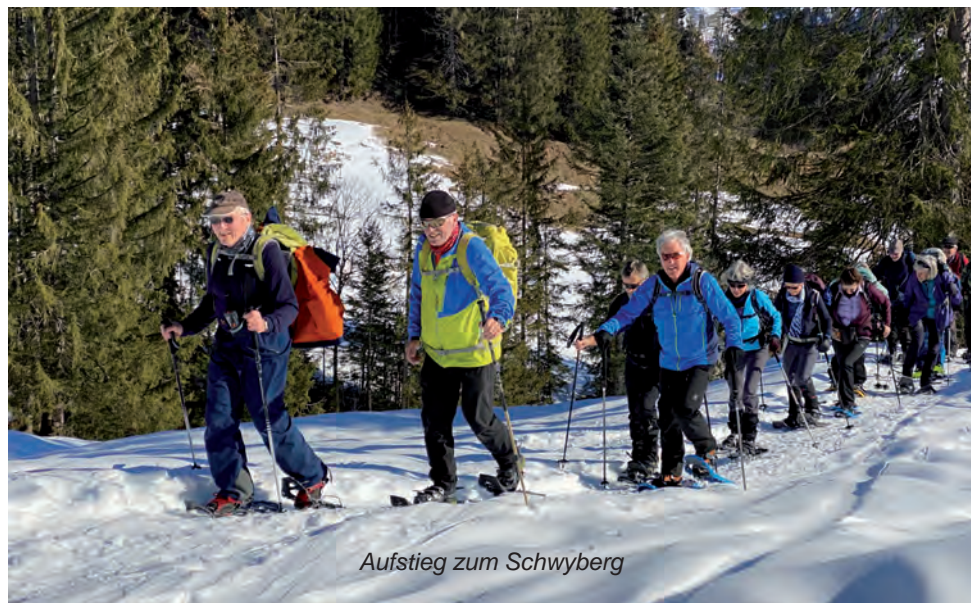
Aufstieg zum Schwyberg

dem Sonnenschein ging es los, in bewährtem Tourentempo stetig den Hang hinauf Richtung Schwyberg. Wir kamen an wunderschönen Alphütten vorbei, wo wir kurze Pausen einlegten, um die prächtige Bergwelt zu bestaunen. Auf dem Fuchses Schwyberg angelangt, empfing uns ein kräftiger Wind, der uns sogar einen Handschuh raubte. Das 360-Grad-Panorama liess uns von Schratzenfluh über Gurnigel, Gastlosen, Moléson, Neuenburgersee, Chasseral bis weit ins