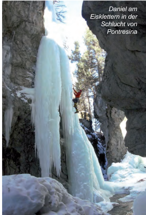
Daniel am Eisklettern in der Schlucht von Pontresina

Die Verhältnisse waren super zum Eisklettern – das Eis war weder zu spröde noch zu weich und die Temperaturen waren angenehm kühl und ohne starken Wind. Aufgrund von Krankheit und der Corona-Pandemie gab es kurzfristige Kursabmeldun-