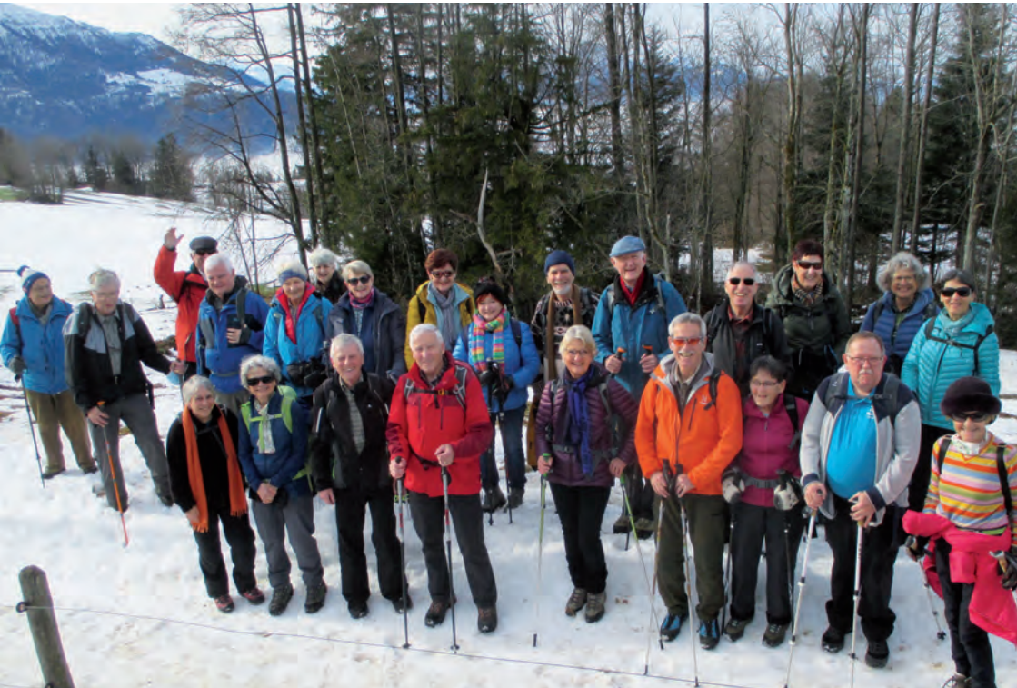
Eine ansehnliche Schar im Schnee