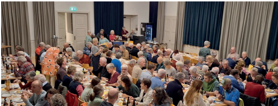
Die Versammlungsgemeinde an der GV 2024